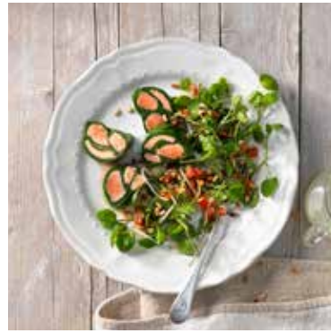
Köstliches Grün Blatt für Blatt ein Genuss