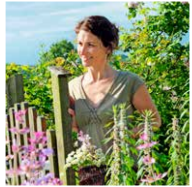
Duftendes Vulkanland Zu Gast bei einer Kräuterfee