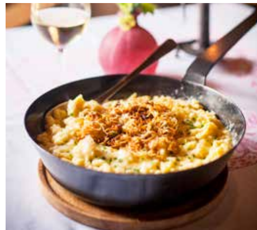
Mitte: Ohne Käsknöpfle sollte niemand Lech verlassen. In der Bodenalpe von Philipp Jochum schmecken sie besonders gut und werden nach alter Tradition im Eisenpfandl serviert.